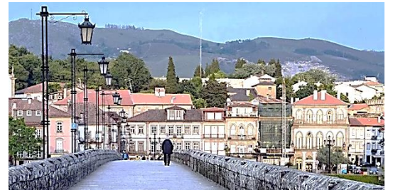
Ponte de Lima

Le Caminho Central au Portugal qui devient le Camino Portugese en Espagne, est un des nombreux chemins de Compostelle. Partant des rives du Douro dans Porto pour aller jusqu'à la cathédrale de Santiago, ce chemin est une source intarissable d'émerveillement! Chemin de pèlerinage historique, lieu intemporel de découvertes et de rencontres, il est le terrain incontesté pour redéfinir son rapport à la vie.