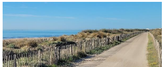
Plage de Sète

Pour bien décanter l'expérience, un temps de relecture vous est offert en fin de parcours dans la magnifique ville de Sète. Ce temps, tel un sas de décompression, vous offrira l'espace pour absorber et retenir les bienfaits de votre pèlerinage, et préparer le retour dans votre quotidien.