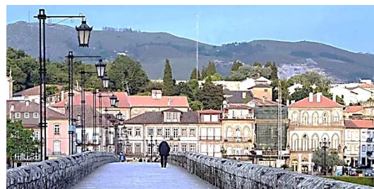
Ponte de Lima

Le Caminho Central au Portugal qui devient le Camino Portugese en Espagne, est un des nombreux chemins de Compostelle. Partant des rives du Douro dans Porto pour aller jusqu'à la cathédrale de Santiago, ce chemin est une source intarissable d'émerveillement! Chemin de pèlerinage historique, lieu intemporel de découvertes et de rencontres, il est le terreau incontesté pour redéfinir son rapport à la vie.