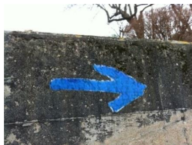
Pèlerin, où vas-tu?

Le pèlerin est celui qui se met en marche, à l'écoute de cet appel qui vibre en lui, ce désir d'un mieux-être. Le chemin est cet espace en mouvement, signe concret de la progression du pèlerin. Il est le lieu de prises de conscience, de rencontres et d'interpellations. Le sanctuaire est l'horizon du pèlerin, celui vers lequel il tend. Le sanctuaire est un lieu qui préserve la vie et permet de s'épanouir pleinement. Dans la démarche proposée par Bottes et Vélo, le pèlerin est invité à se laisser déplacer pour atteindre cet espace intérieur personnel qui appelle le plein épanouissement. Un processus à travers lequel le pèlerin se met en marche, autant physiquement qu'intérieurement, pour goûter la Vie pleinement, consciemment, et cheminer vers une définition concrète de ce sanctuaire qui l'appelle et qu'il porte en lui.